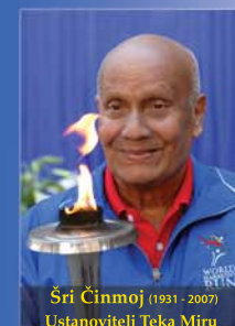
Šri Činmoy (1931 - 2007) Ustanovitelj Teka Miru

Tek Miru je leta 1987 v duhu ljubezni, harmonije in enosti ustanovil danes že pokojni vizionar Šri Činmoy. Ta duh prežema Tek Miru in se dotakne src vseh sodelujočih. Športnik, filozof, glasbenik in poet - Šri Činmoy je svoje življenje posvetil širjenju idealov svetovnega prijateljstva in enosti.