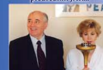
Michail Gorbatschow skupaj z ženo Raiso Maximovno...