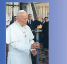
Papež Janez Pavel II blagoslovi plamenico...