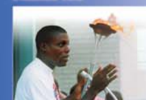
Devetkratni olimpijski prvak Carl Lewis govori o ciljih teka