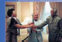
Nelson Mandela, bivši predsednik JAR...